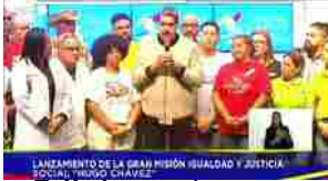
Venezuela, le presidenziali si terranno il 28 luglio

Antitrust a Comuni, aumentare le licenze dei taxi