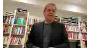
Alessandra Sardoni del Tg La7 premiata al Milazzo Film Festival. Il commento di Mentana