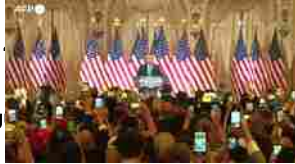
Trump: "E' stato davvero un 'Super Tuesday' per noi"